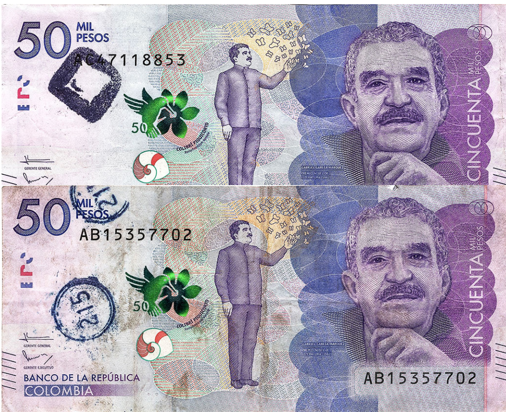
1.5. Mutilaciones y agujeros

Sellos estampados por entidades o establecimientos que ocasionan deterioro prematuro de los billetes, y que por su tamaño o densidad de la tinta los convierte en no aptos para su circulación.