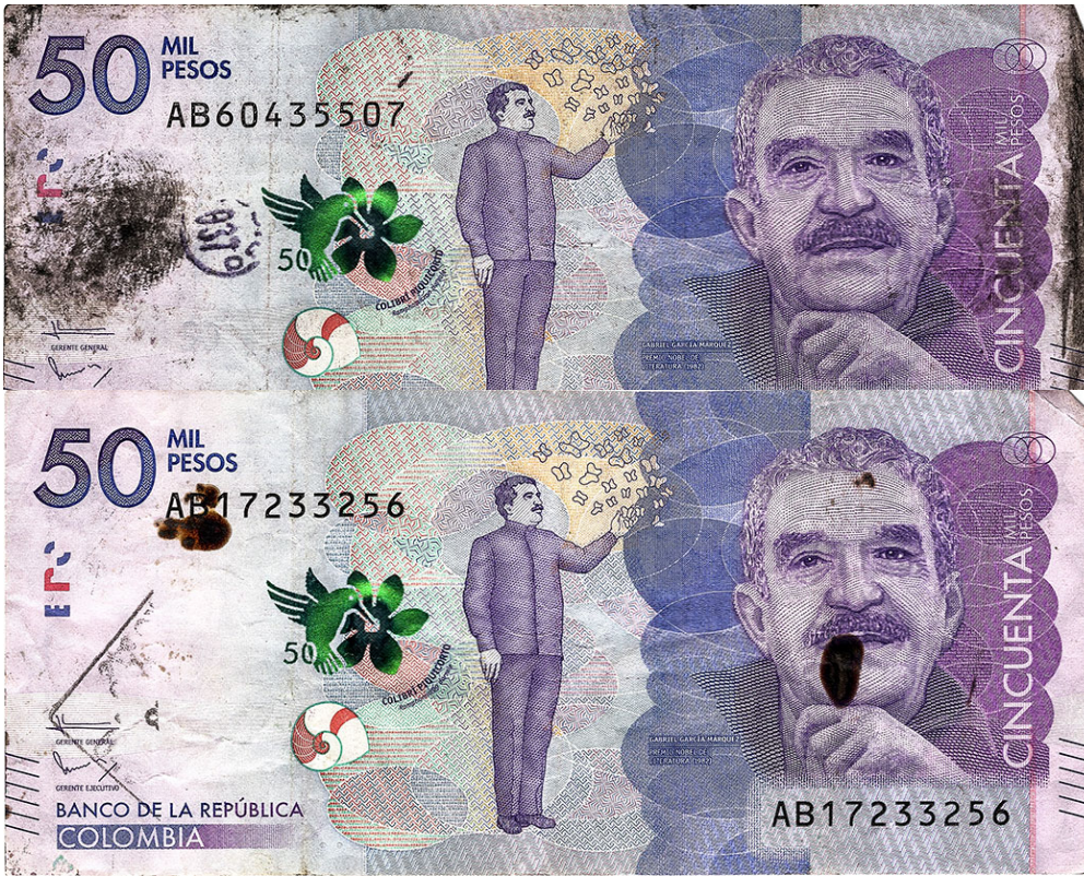
1.3. Escrituras y dibujos (grafiti)

Corresponden al deterioro del billete realizado a causa de la escritura de cifras, letras o dibujos en la superficie del billete. A continuación, se ilustran algunos ejemplos: