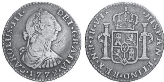
FIGURA VII.14. Moneda de plata de un real de 1772

Moneda de plata de un real de 1772 de la ceca de Santa Fe, posterior a las órdenes secretas de Carlos III de 1771 para reducir la ley de la moneda. A diferencia del diseño anterior con el escudo nacional en el anverso, este lleva en su lugar el busto del monarca y en el reverso aparece el escudo flanqueado por las columnas de Hércules, con la leyenda “Plus Ultra”, un diseño que perduraría hasta nuestros días en la moneda española.