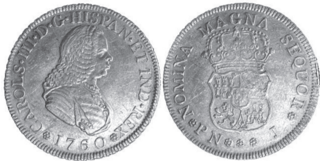
FIGURA VII.8. Moneda de oro de cuatro escudos de 1760

Moneda de oro de cuatro escudos de 1760 de la ceca de Popayán. Estas atractivas piezas con el busto de Fernando VI, emitidas luego de la incorporación de la ceca a la Corona, son un ejemplo del primer diseño de la moneda de oro de cordoncillo. De la gran peluca que adorna el busto del monarca, viene el apelativo de peluconas con que se conocen entre nosotros.