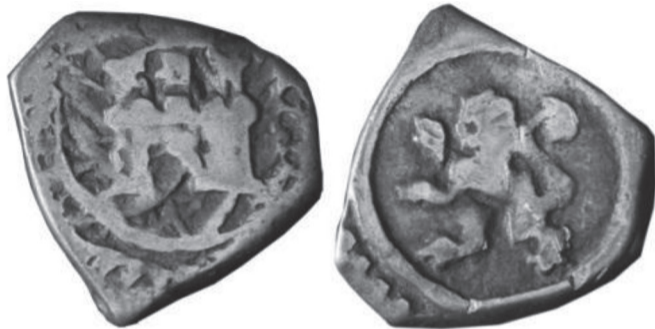
FIGURA VII.15. Cuartillo de plata macuquino

Cuartillo de plata macuquino, anepígrafo, de la Casa de Moneda de Santa Fe con las improntas de castillo y león utilizadas hasta la Independencia del Nuevo Reino. Estos cuartillos de ley 11 dineros y 4 granos (930,5 milésimas) fueron acuñados en Santa Fe en reemplazo de los de vellón rico, posiblemente a partir de 1627 y hasta la aparición de la moneda circular a mediados del siglo XVIII.