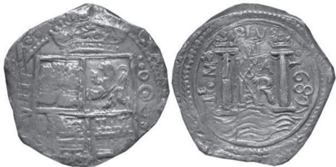
FIGURA VII.11. Moneda macuquina de plata de 8 reales de 1687

Moneda macuquina de plata de ocho reales de 1687 de la ceca de Santa Fe, con el nuevo diseño de columnas adoptado luego del “gran escándalo” de las peruleras.