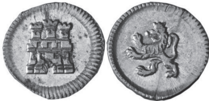
FIGURA VII.16. Cuartillo de plata circular

Cuartillo de plata circular, anepígrafo, con las mismas improntas de castillo y león de los anteriores macuquinos de la ceca de Santa Fe. Se acuñaron desde la aparición de la moneda de cordoncillo en 1756 hasta quizá 1796, en época de Carlos IV, cuando se agregó la fecha, el valor y la marca de ceca. La ley que inicialmente fue de 11 dineros (916,6 milésimos), con las reducciones secretas quedó en 10 dineros y 18 granos (896 milésimas) a partir de 1786. Diámetro: 11-12 mm; peso: 0,85 g.