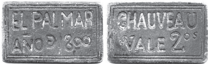
FIGURA VII.19. Seña colombiana de 1800

No solo las tiendas y pulperías usaban las señas. Esta, emitida por alguien de apellido Chauveau para uso en su hacienda El Palmar, lleva el año 1800, que la hace la más antigua conocida entre las señas colombianas con fecha.