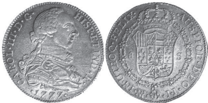
FIGURA VII.13. Moneda de oro de ocho escudos de 1777

Moneda de oro de ocho escudos de 1777 de la ceca de Santa Fe, con el diseño utilizado a partir de 1772, luego de las órdenes secretas de Carlos III de 1771 para reducir la ley de la moneda. El busto del rey tiene facciones más maduras que el utilizado en las monedas anteriores a 1772.