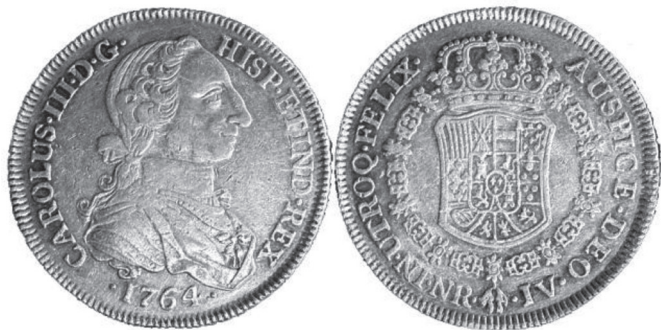
FIGURA VII.12. Moneda de oro de ocho escudos

Moneda de oro de ocho escudos de la ceca de Santa Fe con el busto de Carlos III, anterior a las órdenes secretas de 1771 para reducir la ley de la moneda. Nótese el busto del rey con facciones más juveniles que el utilizado en las monedas posteriores a 1771.