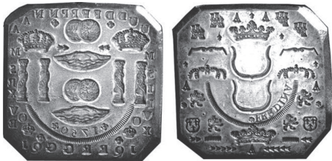
FIGURA VII.6. Matrices de acero

Matrices de acero con las improntas en negativo de los elementos de diseño de ambas caras de una moneda de plata de ocho reales del primer tipo de cordoncillo, transferidas al troquel por medio de punzones. Eran elaboradas por grabadores de Sevilla y Madrid y se conocían como pilas .