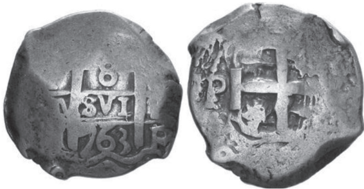
FIGURA VII.2. Moneda macuquina de plata de ocho reales

Moneda macuquina de plata, de valor ocho reales, de la casa de moneda de Potosí, con fecha de 1763.