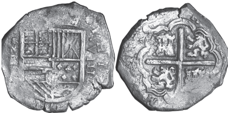
FIGURA VII.5. Moneda macuquina de plata de ocho reales