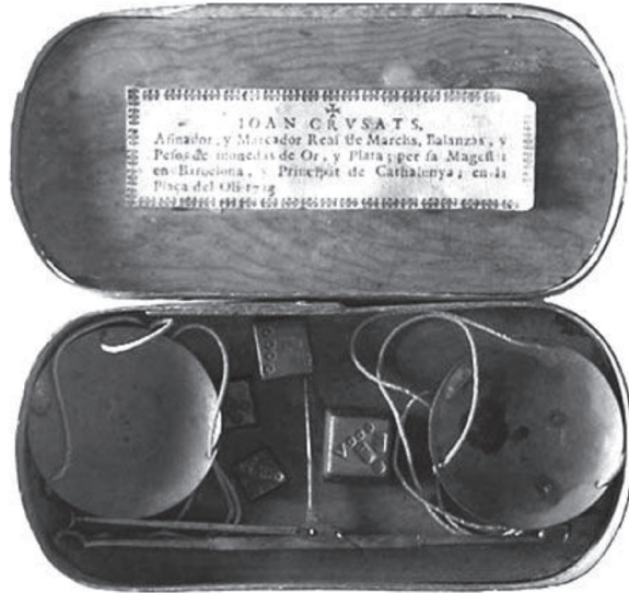
FIGURA VII.4. Balanza monetaria de bolsillo para monedas de oro

Balanza monetaria de bolsillo para monedas de oro, fabricada en 1733 por el barcelonés Joan Crusats. De uso corriente entre los comerciantes de la época, en vista de la multitud de monedas recortadas y falsificadas en circulación, que los obligaba a pesarlas antes de aceptarlas.