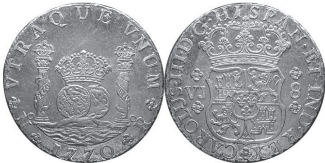
FIGURA VII.7. Moneda de plata de ocho reales de 1770

Moneda de plata de ocho reales de 1770 de la ceca de Santa Fe. Un ejemplo del hermoso diseño de las primeras monedas circulares, con el escudo español por el anverso y en el reverso las columnas de Hércules, con la leyenda “Plus Ultra” flanqueando los dos mundos, el nuevo y el viejo, ambos bajo la Corona española, y todo ello sobre las ondas del océano.