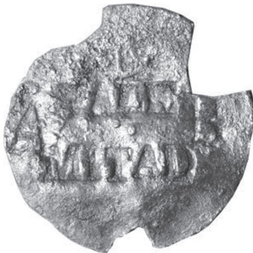
FIGURA VII.18. Seña hallada en Cartagena, atribuida a los años 1815-1821

Seña hallada en Cartagena junto con algunas monedas de cobre de corte realista, atribuidas a los años de la reconquista española (1815-1821). Con 30 mm de diámetro y repujada en una delgada lámina de cobre, a pesar de los trozos faltantes y otros estragos de la corrosión, aún se ve en ella la leyenda en letras incusas VALE / MITAD, la forma de denominación usual en las primeras señas colombianas conocidas, equivalente a medio cuartillo.