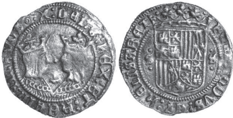
FIGURA VII.1. Moneda de oro de un castellano

Llamada también medio excelente o dobla, esta moneda de oro de un castellano lleva en el anverso las efigies opuestas coronadas de Fernando de Aragón e Isabel de Castilla, los Reyes Católicos. Fue acuñada por los años del descubrimiento de América.