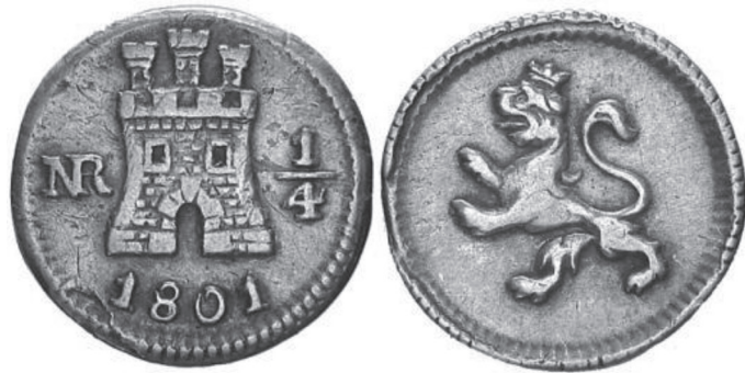
FIGURA VII.17. Cuartillo de plata circular

Cuartillo de plata circular con las mismas improntas de castillo y león de los anteriores anepígrafos, pero con la adición de la fecha, el valor y la marca que identifica la ceca, en este caso NR de Santa Fe. Con una ley de 10 dineros y 18 granos (896 milésimas), se acuñaron entre 1796 (o poco antes) y 1819, casi sin interrupción. Diámetro: 11-12 mm; peso: 0,85 g.