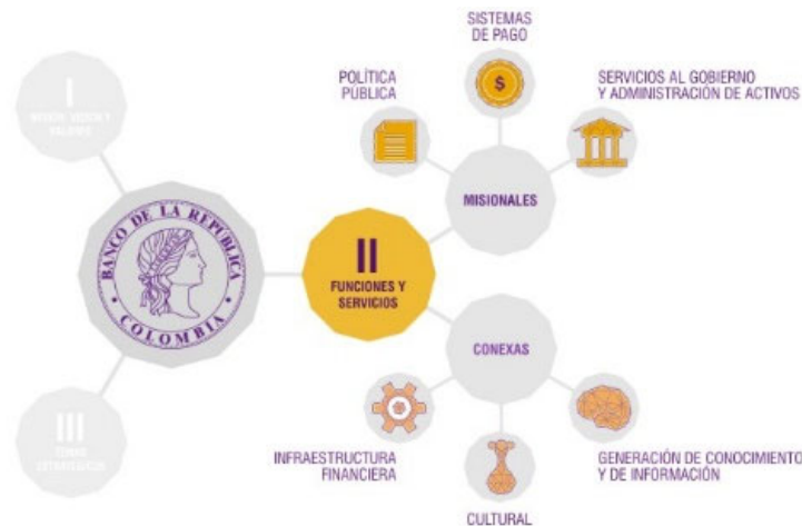
Gráfico 1. Funciones Misionales y Conexas

En el marco de elaboración del Plan Estratégico se efectuó una revisión de las funciones y servicios, los cuales se agruparon en dos categorías: misionales y conexos. Ambos se enmarcan dentro de las autorizaciones y mandatos otorgados por la Ley 31 de 1992. Las funciones misionales corresponden a las actividades esenciales de banca central, en tanto que las conexas corresponden a aquellas que apoyan estas funciones o que están relacionadas con la gestión cultural (Gráfico 1).