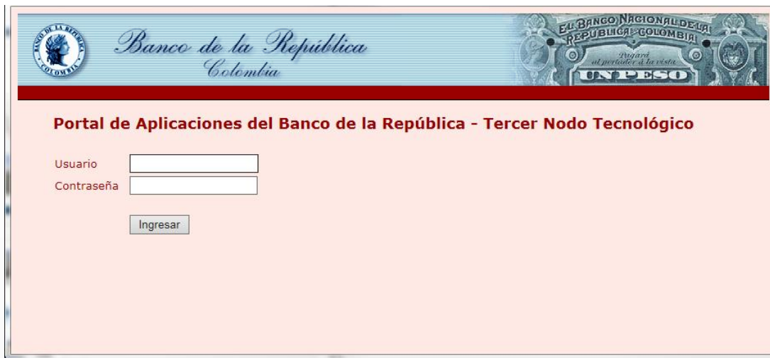
Ambiente de Alterno (Contingencia) – WSEBRA3N