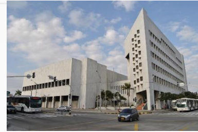
BR - BARRANQUILLA