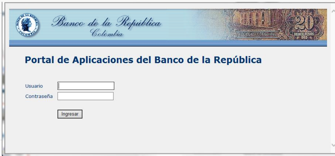
Ambiente de Producción - WSEBRA