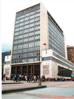
BR - BOGOTA