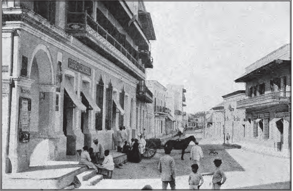
FIG. 5. ESCENA CALLEJERA, BARRANQUILLA.