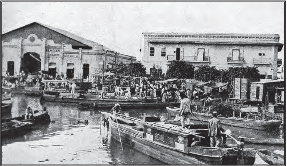
FIG. 6. BARCOS Y CASETAS EN EL AGUA, BARRANQUILLA.