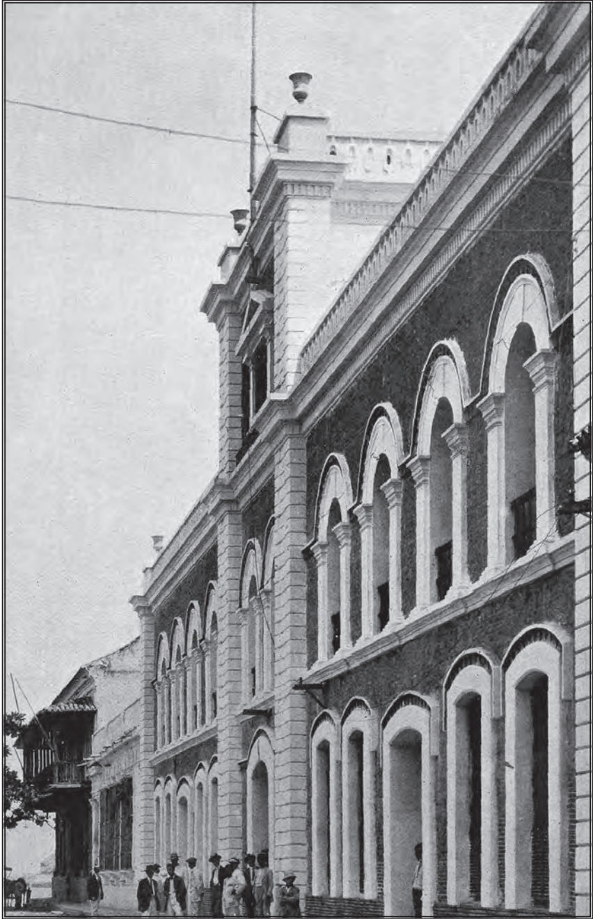
FIG. 2. EDIFICIO DE GOBIERNO, SANTA MARTA.