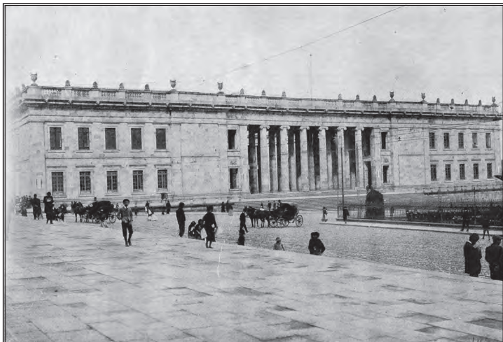
FIG. 1. CAPITOLIO NACIONAL DE COLOMBIA, BOGOTÁ